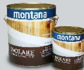
Disponível em embalagens de 3,6L e 900ml

O inovador Isolare Incolor base água possui alta transparência, além de ser excelente isolante para espécies resinosas, é uma boa alternativa de acabamento para qualquer tipo de madeira em ambientes internos.