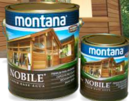
Disponível em embalagens de 3,6L e 900ml