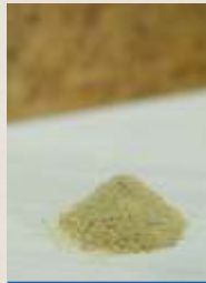
Resíduo - Brocas